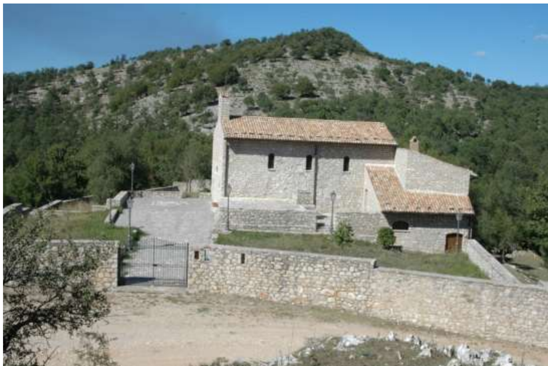
Facciata sud del fabbricato

Esternamente i due ambienti sono collegati da una corte pavimentata con al centro la cisterna di raccolta delle acque piovane.