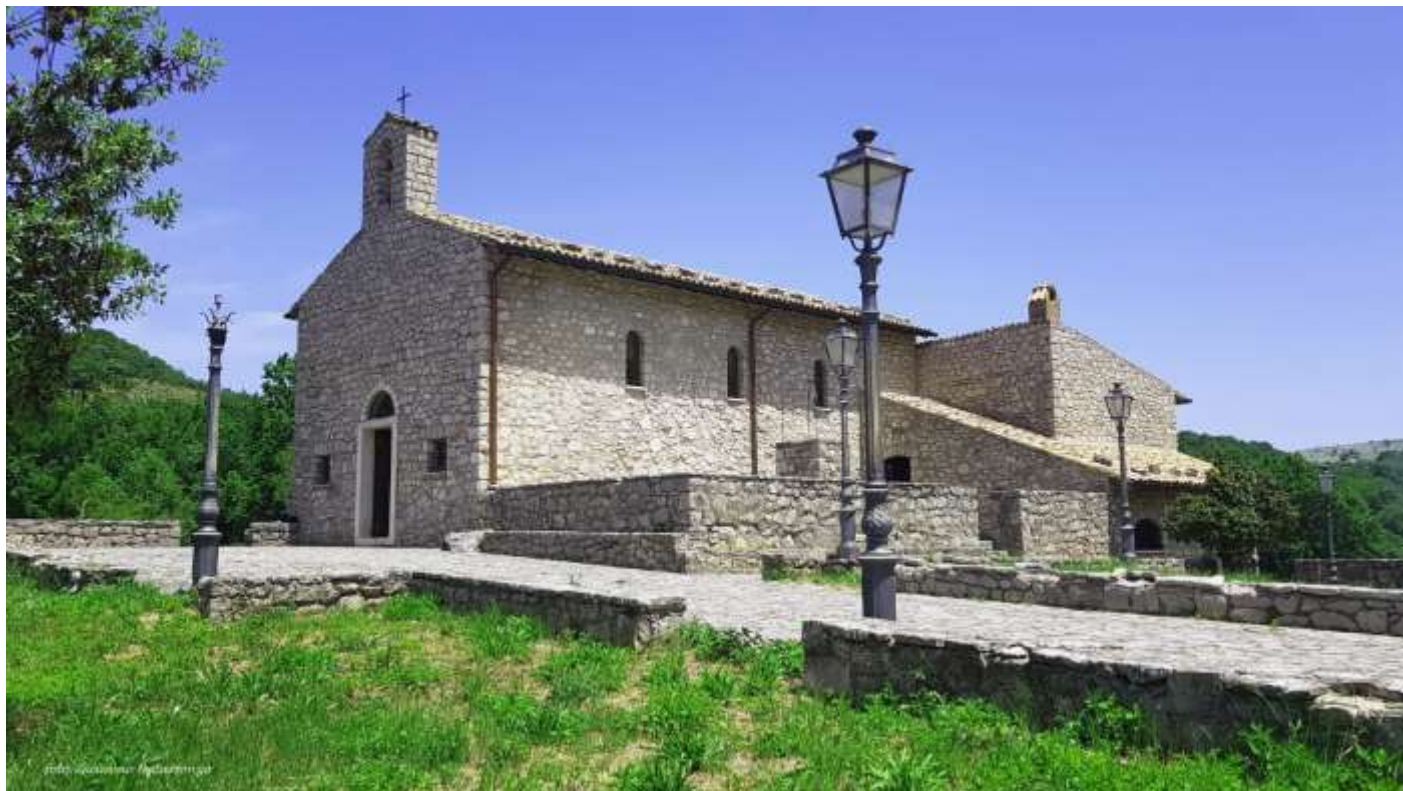
Angolo sud/ovest del fabbricato

La struttura del fabbricato risulta così costituita: