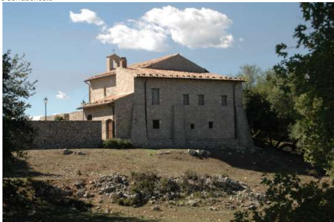
Facciata est del fabbricato